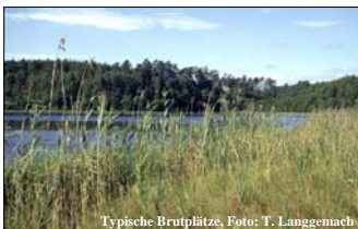
Typische Brutplätze