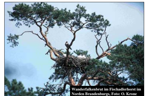
Wanderfalkenbrut im Fischadlerhorst im Norden Brandenburgs, Foto: O. Krone

Das Projekt wird allen IUCN-Kriterien für Wiederansiedlungsprojekte gerecht.